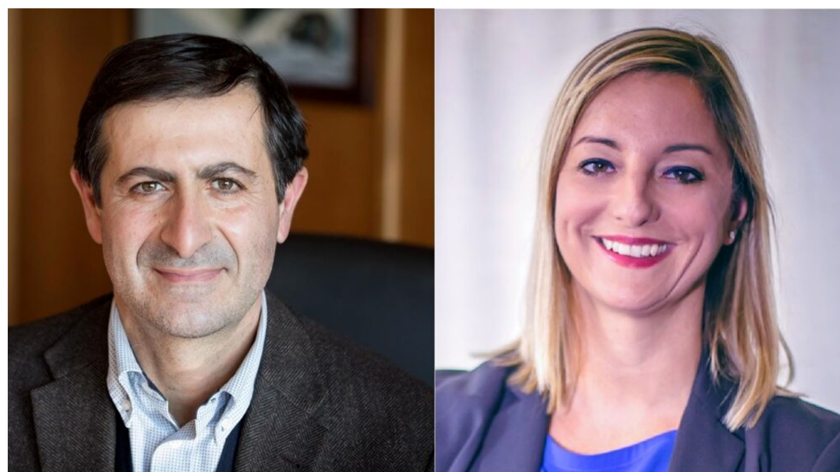
Gli assessori regionali Valeriani (Rifiuti) e Roberta Lombardi (Transizione Ecologica)

L'assessora regionale M5S alla Transizione Ecologica Roberta Lombardi , dopo lo "sconcerto per gli arresti di Valter Lozza e Flaminia Tosini" - proprietario della discarica di Roccasecca e sospesa direttrice della Direzione Ambiente-Rifiuti della Regione Lazio - lancia una proposta di legge assieme all'assessore ai Rifiuti Massimiliano Valeriani . Quella che introdurrebbe nuove regole per le Via e le Aia da rilasciare in materia di rifiuti. Anche in quella provincia di Frosinone spesso tempestata da lungaggini burocratiche nonché da inchieste giudiziarie .