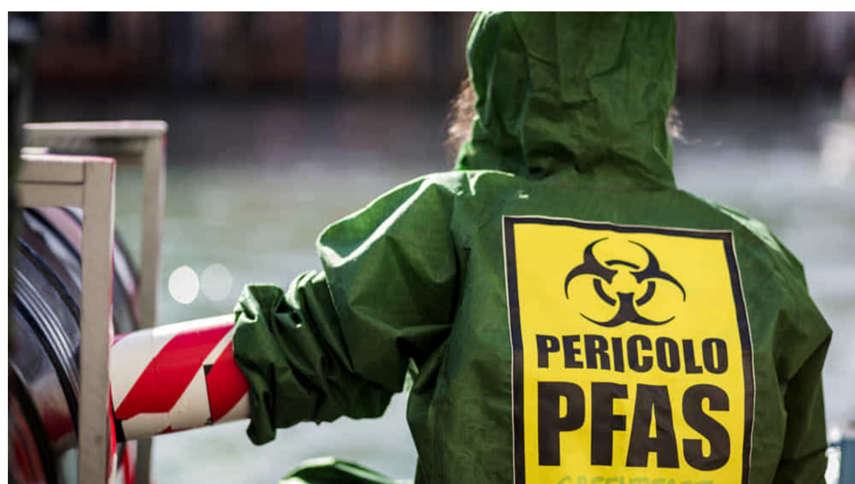
Immagine di repertorio

È online il nuovo sito di informazione e approfondimento sui temi legati all'inquinamento da Pfas,