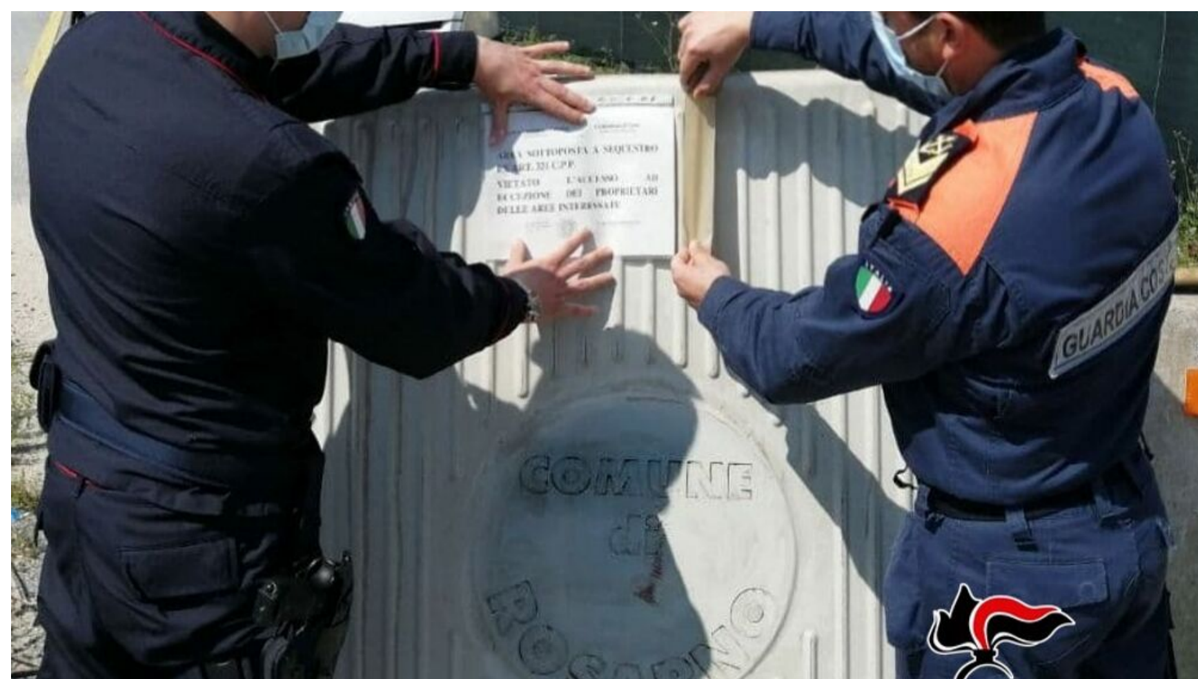
I Carabinieri pongono i sigilli sull'area sequestrata

È costante l'azione di prevenzione e contrasto ai molti fenomeni criminali, a tutela dell'ambiente per l'Arma nel territorio della Piana di Gioia Tauro - tra i quali lo sversamento illecito di rifiuti - grazie anche al supporto dei carabinieri Forestali e dei reparti specializzati.